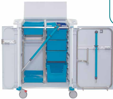
80975 KeyCar Medium SA