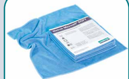
82142 Microwit SOFT blau